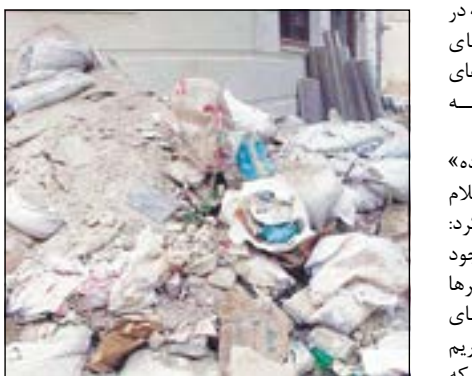
با کسانیی که در