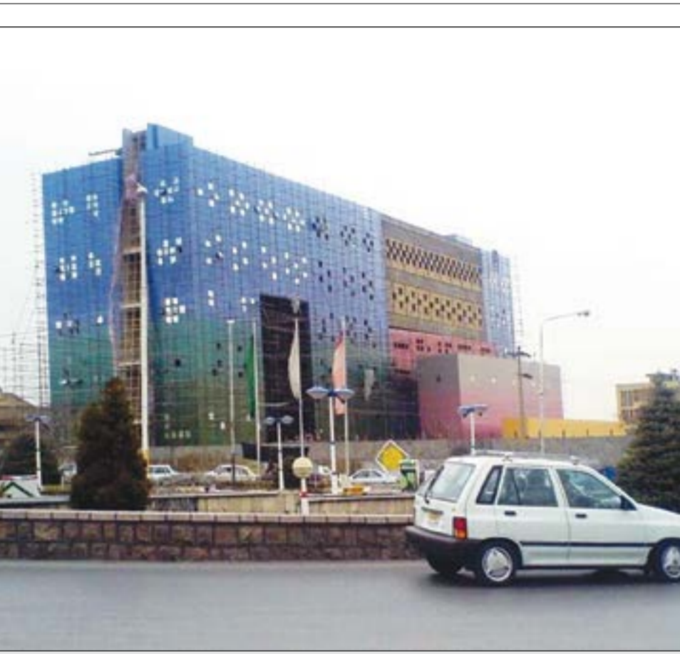
نمایی از بنای در حال ساخت کتابخانه مرکزی مشهد

معاون سیاسی، امنیتی و اجتماعی استاندار خراسان رضوی فرهنگ‌سازی برای رشد فرهنگ کتابخوانی مدنظر است.