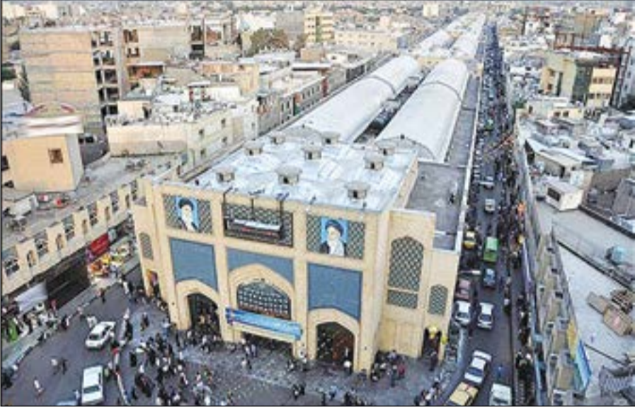
نمایی از بازار رضای مشهد

■ سازمان نیازمندی‌ها (امور استان‌ها): ۸۸۸۶۱۸۱۹ - ۰۲۱ -