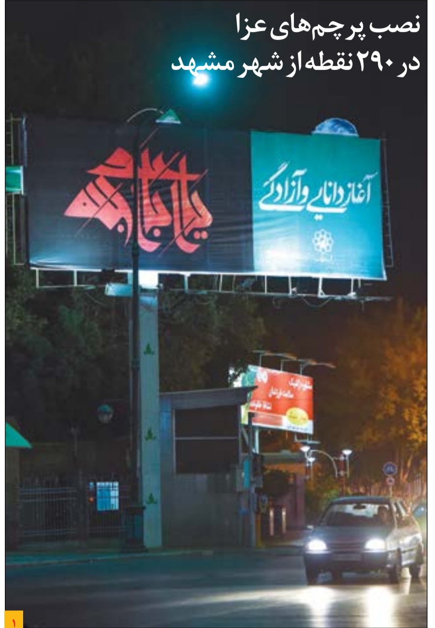
نمایی از نصب پرچم‌های محرم در شهر مشهد.