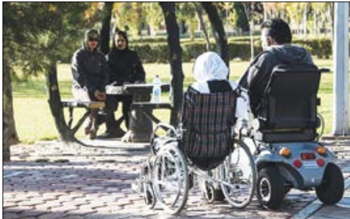
هزار و ۱۵۰ مرکز روزانه آموزشی و توانبخشی در کشور فعال هستند

اصلاح و بازنگری قانون جامع حمایت از حقوق معلولان به زودی در صحن علنی مجلس مطرح می شود