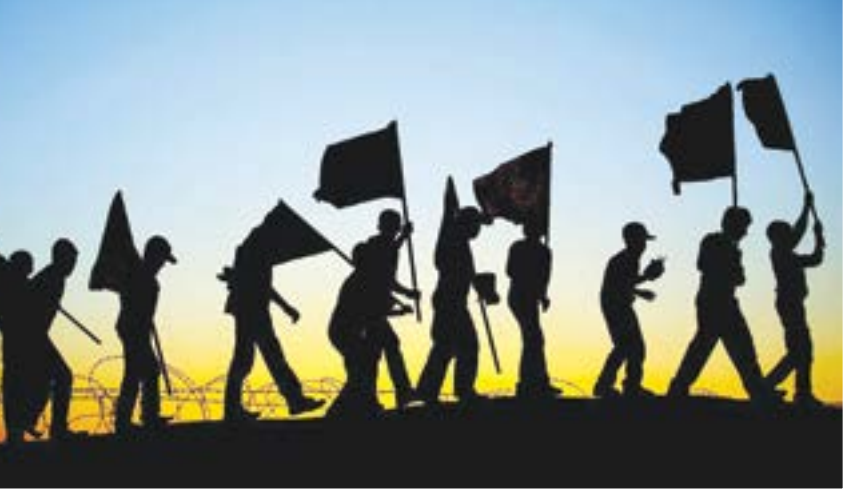
■ عکس:ها همشهری

همه سختی‌ها و زحمت‌های بی‌شمار ۸ سال همراه رژیم یعنی صدام به ایران در آخرین روز شهر یوز آزی خطر، جلوه‌ای از عزت و با یغردی و با هر بانگ الله اکبر، موزه‌ای از دلدادگی و جان‌فشانی را رقم زدند.