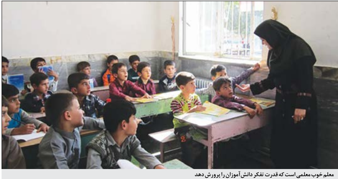
معلم خوب معلمی است که قدرت تفکر دانش آموزان را پرورش دهد