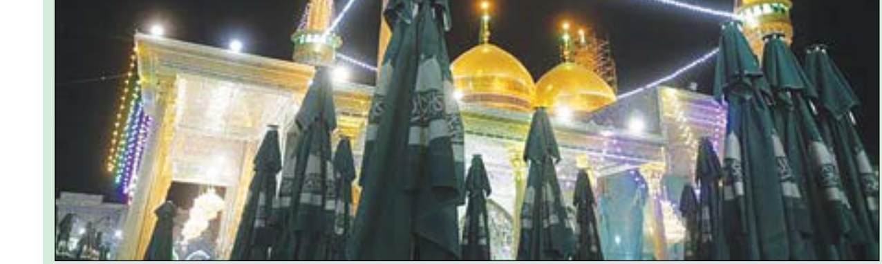
نمایی از بارگاه امام جواد(ع) در شهر کاشمیر

نقل شده وقتی امام جواد(ع) به دنیا آمد، امام رضا(ع) فرمودند: «حق تعالی فرزندتی سه من عطا کرد که همچون موسی‌بن عمران دریاها را می‌سکافت و مثل عیسی بن مریم خداوند مادرش را مقدس گردانیده و او طاهر و مطهر آفریده شده است.» آن وقت گفت: «این کودک که جور و ستم کشه خواهد شد و اهل آسمان‌ها برای گریه خواهند کرد، خدای متعال بر دشمن و اهل بیت خود خفاورده و در آن‌ها بعد از آن قبل او پهرای از زندگی نخواهند برد و به زودی می‌آید عذاب الهی واصل خواهد شد.»