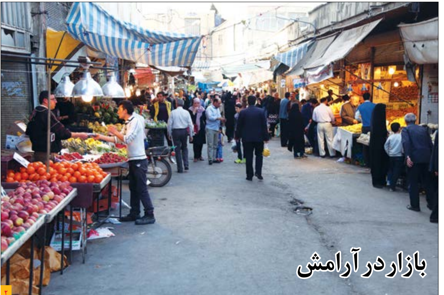
بازار در آرامش

رئیس شورای شهر همدان: ۲ گزینه بومی و ۴ گزینه غیر بومی برای تصدی پست شهرداری مطرح است