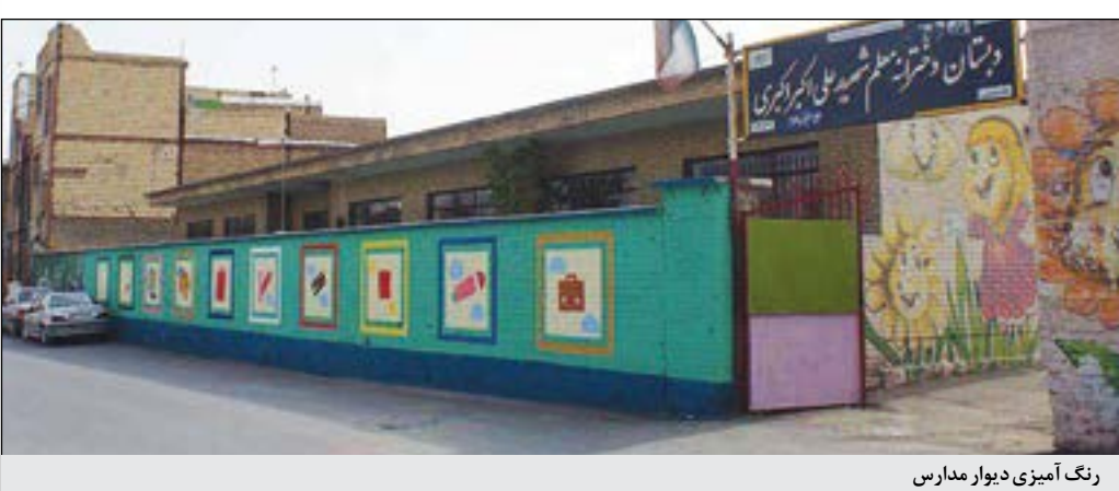
رنگ آمیزی دیوار مدارس

آغاز می‌کنند. مد‌برعامل سازمان سیما و منظر و فضای سبز شهرداری همدان ادامه می‌دهد: این آفت‌ها در فصل سرد سال پاییز خزان می‌شوند. هدف از این برنامه افزایش مقاومت گیاهان محیط شهری در خزان در بین سیم‌های شبکه توزیع برقی شهری، احتمال قطع برقی را افزایش می‌دهد که هرس اصولی و منطقی مانع از آن می‌شود شاهد طغیان رشد و افزایش این گونه‌ها هستیم که هزاره‌های تنوع زیستی و احیای فضای سبز شهری را با افزایش صرف هم