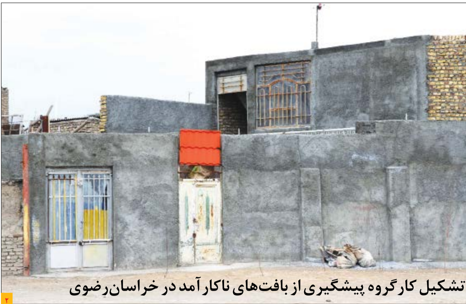
تشکیل کارگروه پیشگیری از بافت‌های ناکارآمد در خراسان رضوی