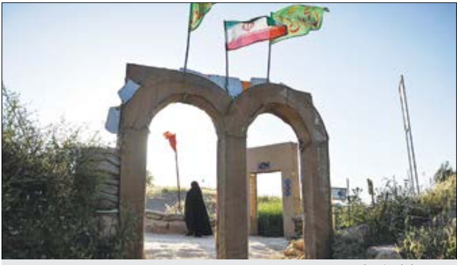
موزه شهدای اردبیل

طرح بزرگ فرهنگی دیگر پروژه تبیین نقش استان اردبیل در دفاع مقدس است. این پروژه شامل ۱۰ مجموعه کتاب خواهد بود که هر کتاب با موضوع نقش یک شهرستان در دفاع مقدس به نگارش درمی‌آید. برای تکمیل این طرح قراردادی با ۱۰ نویسنده زنده استان منعقد شده است و در حال حاضر در هر شهرستان کار تحقیقاتی به شکل هیات‌انمایی و با همکاری