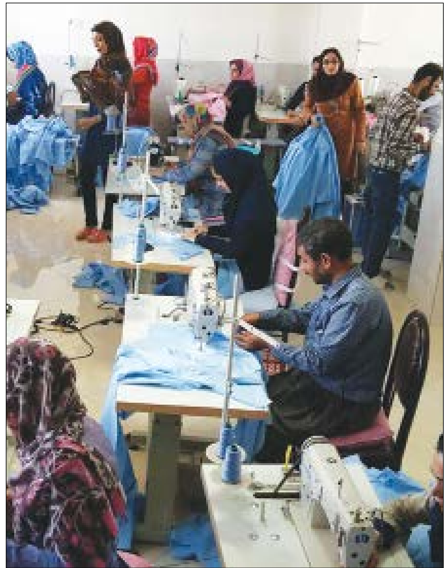
یک کارگاه تولیدی برای اشتغال معلولان