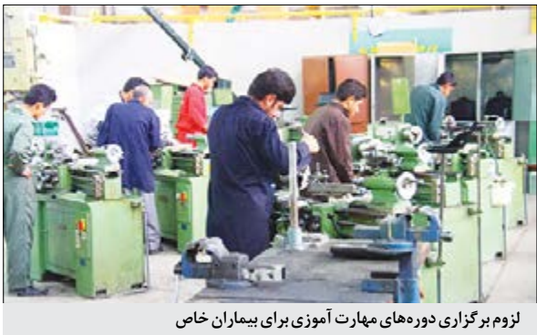
لزوم برگزاری دوره‌های مهارت آموزی برای بیماران خاص